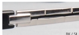
BK / SI