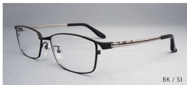
BK / SI