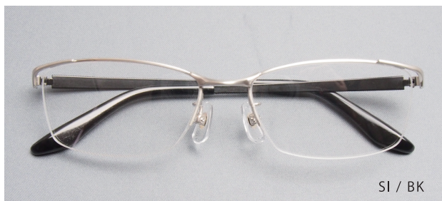
SI / BK