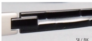
SI / BK